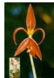
Flor de Lis emblema scout