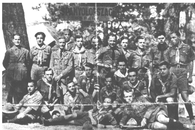
Jamboree de Hungría, 1933 . Campamento español, compuesto por Exploradores de Albacete, Madrid, Cataluña, Málaga, Murcia, Santander y Zaragoza.