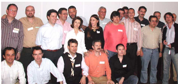
Tropa Esculta Brownsea. XXX aniversario 1976-2006