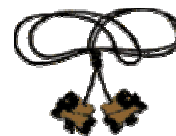
Director de Formación (4 cuentas y collar)